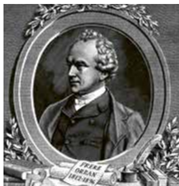
H.J.W. Frère-Orban, oprichter van de Nationale Bank (1850).

Het streven van minister Frère-Orban om handelskrediet binnen het bereik van ondernemingen en handelaars te brengen door aan de belangrijkste agentschappen van de Bank discontokantoren te koppelen, wordt snel uitgevoerd. Dankzij die formule kan de Bank, die de door de kantoren gediscoteerde effecten herdisconteert, haar werkterrein snel uitbreiden. De eerste kantoren – Luik, Gent, Charleroi en Bergen – gaan open vanaf 1851, binnen het decennium gevolgd door eenentwintig andere, en daarna nog door elf na 1865. Antwerpen [tot in 1952] bezit, evenmin als Brussel, een kantoor, maar beschikt over een discontocomité dat in een verschillend kader werkt. Door een verandering van het juridische statuut van de kantoren in 1872 wordt de rol van de agenten van de Bank echter beperkt tot die van waarnemers.