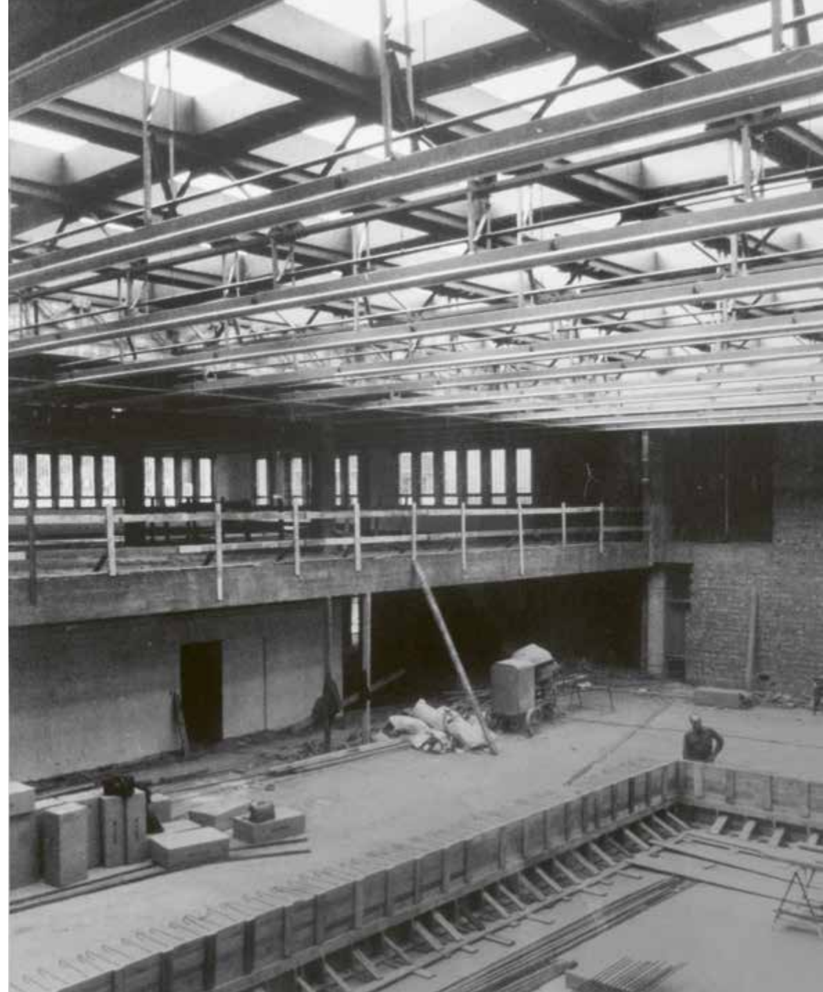
Het atrium in aanbouw

Nog erger is dat het grote glazen dak in 1997 om veiligheidsredenen gesloten werd, waardoor de originele kwaliteiten van de architecturale ruimte verloren gingen.