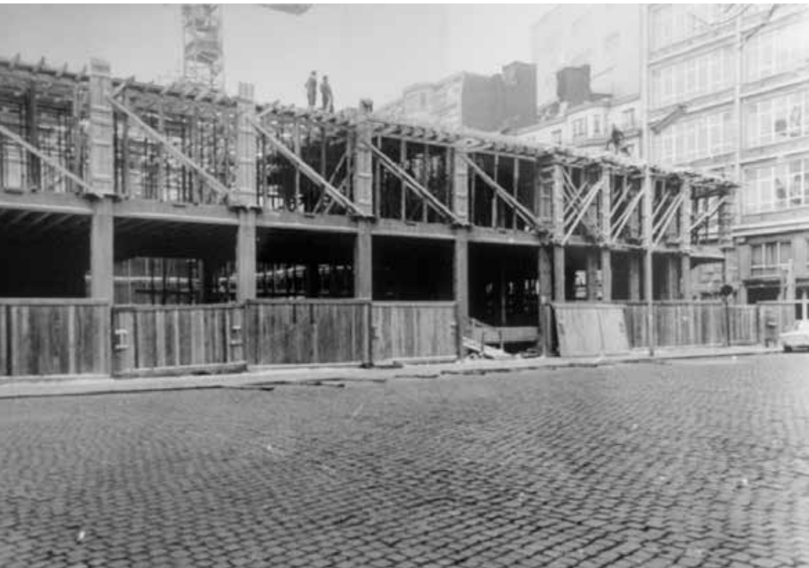
Structuur van de façade in aanbouw