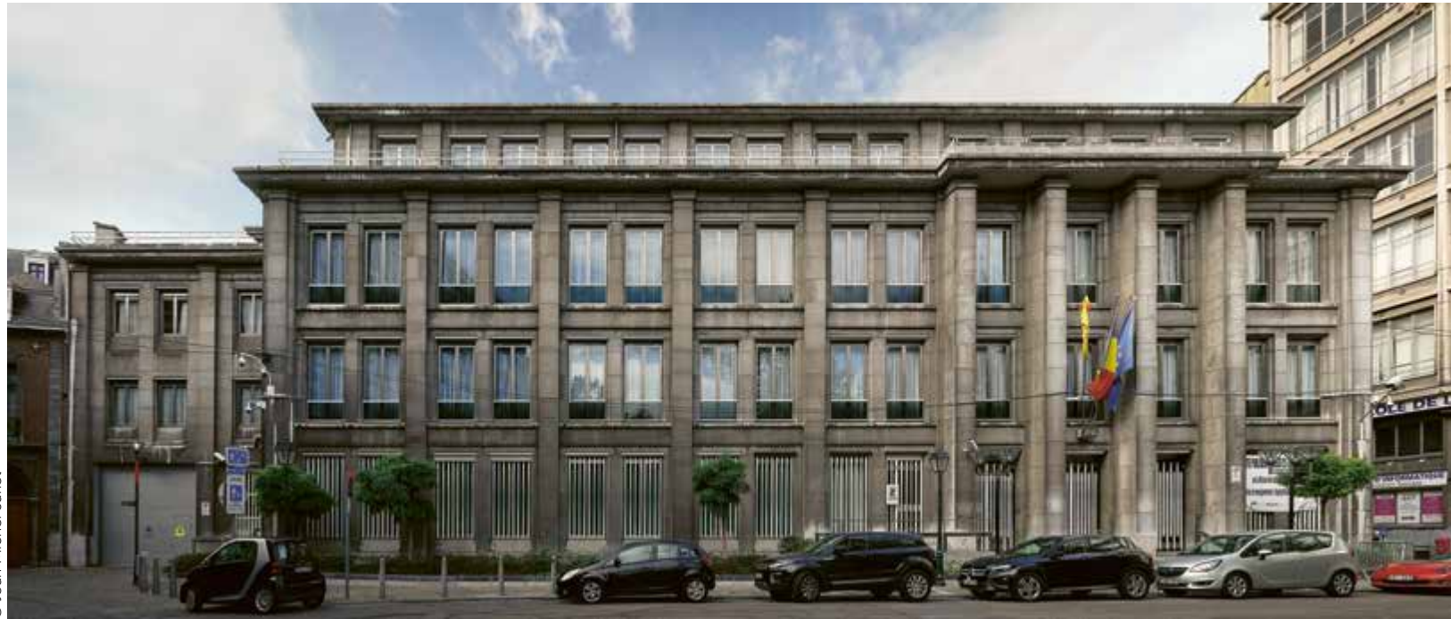
De gevels van het gebouw van de Nationale Bank in Luik zijn opgetrokken in een esthetisch gezien neoclassicistische stijl