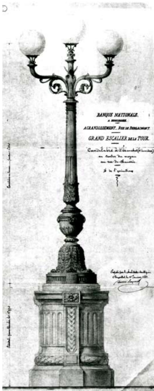
Ontwerp van de kandelaber voor de trappentoren, 1881. Tekening: H. Beyaert.

de te gebruiken energiebronnen (petroleum, gas, elektriciteit), de plaatsing van de installaties, het functioneel en esthetisch aspect van de verlichting als wat betreft de vakbekwaamheid en de betrouwbaarheid van de bedrijven, die voor de levering en uitvoering in aanmerking kwamen. Als aandeelhouder van de «Compagnie des Bronzes» was Hendrik Beyaert zeer goed op de hoogte van de mogelijkheden van dit Belgische bedrijf dat hij ten zeerste waardeerde. Op 25 juni 1868 ontving de Compagnie dan ook een bestelling voor 72 apparaten (girandes, lantaarns, kandelabers en luchters) voor een totaalbedrag van 39.995 Belgische frank. De grote luchters in kristal en in verguld brons vormden het meest prestigieuze onderdeel van het lastenboek, maar tegelijkertijd een moeilijk uit te voeren werk. De luchters werden gemaakt op basis van de pleisteren modellen van de Parijse beeldhouwer Georges Houtstont (1832-1912). Naar aanleiding van de laatste leveringen van deze eerste grote bestelling in 1871, bracht de «Compagnie» de Gouverneur op de hoogte van het belang van deze «nationale bestelling»: « Het is voor ons geen kleine voldoening te hebben bewezen aan hen, die de eerste financiële instelling van dit land besturen, dat België over een